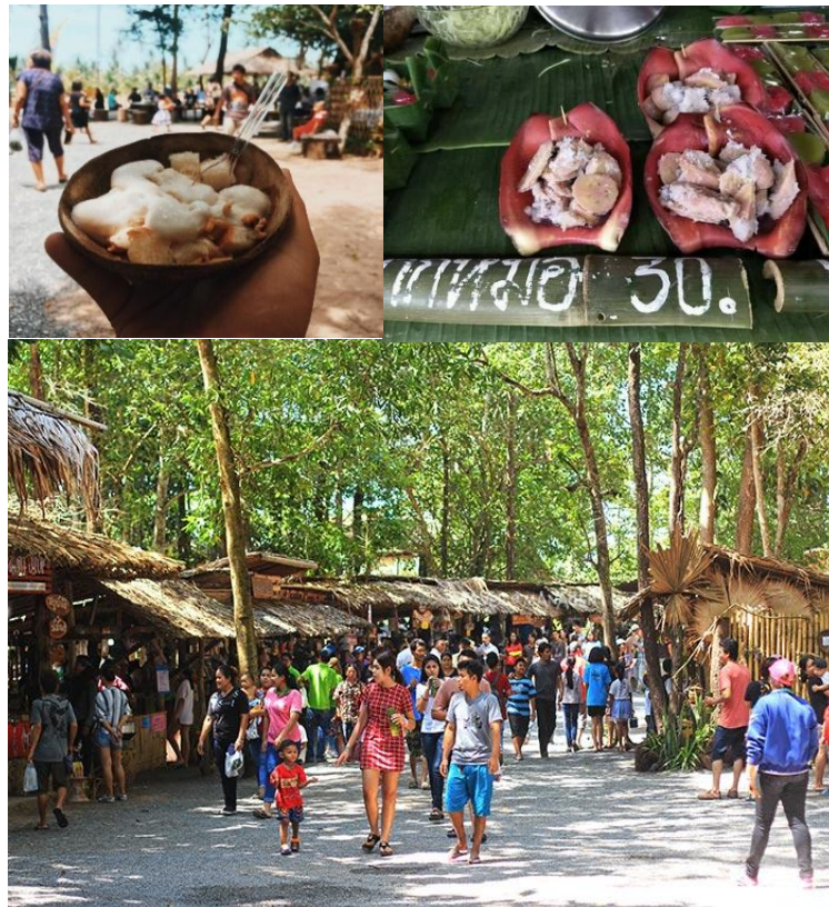
ภาพประกอบที่ 2 ตัวอย่างอาหารในตลาดใต้เคี่ยม

คณะกรรมการหน่วยงานภาครัฐและองค์กรเอกชนที่เกี่ยวข้อง ได้แก่ กลุ่มชาวบ้าน กลุ่มชมรมกำนัน ผู้ใหญ่บ้าน ให้ความร่วมมือปฏิบัติตามกฎระเบียบ และมาตรการเพื่อดูแลรักษาความมั่นคงของตลาดใต้เคี่ยมให้เป็นไปในทิศทางเดียวกันและสอดคล้องกับวิถีชีวิตของชาวบ้าน